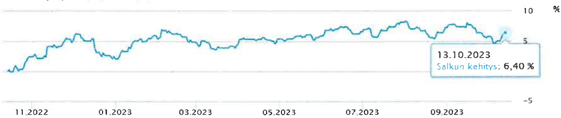
Salkun kehitys jaksittain ajalta 13.10.2022 - 13.10.2023